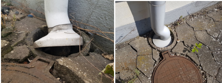
Figur 1 billede af usikret og et sikret tagnedløb